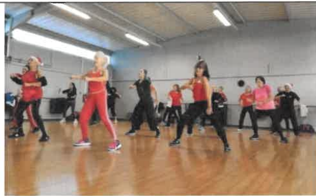
Corps en mouvement