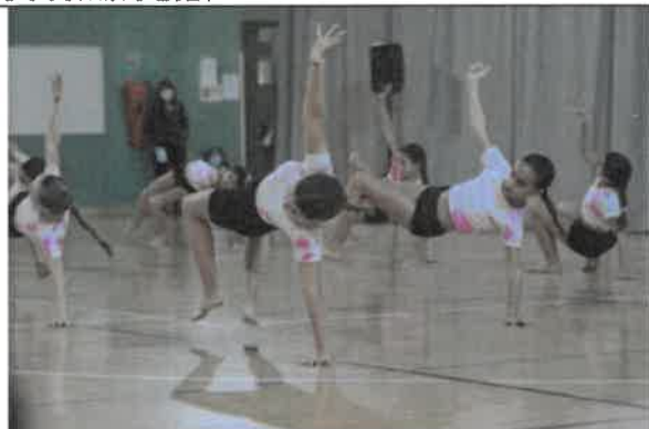
Portes ouvertes Danse au gymnase