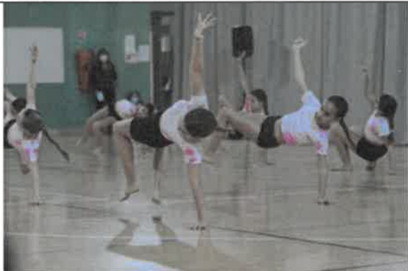
Portes ouvertes Danse au gymnase