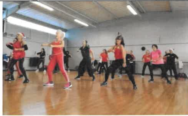
Corps en mouvement