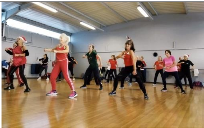
Corps en mouvement