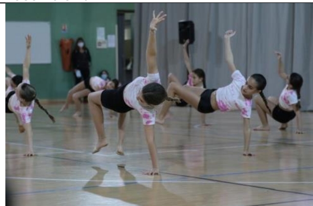
Portes ouvertes Danse au gymnase