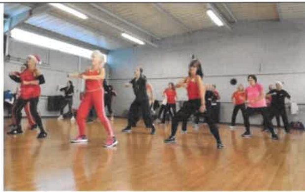
Corps en mouvement