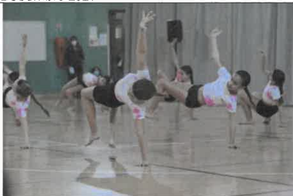
Portes ouvertes Danse au gymnase